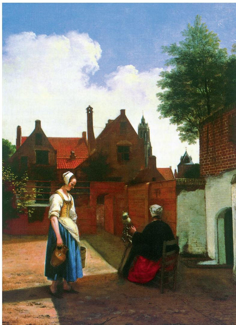
'Twee vrouwen op een binnenplaats' door Pieter de Hooch (1629-1684), London, Royal Collection. De vrouw rechts is met de hand aan het spinnen.